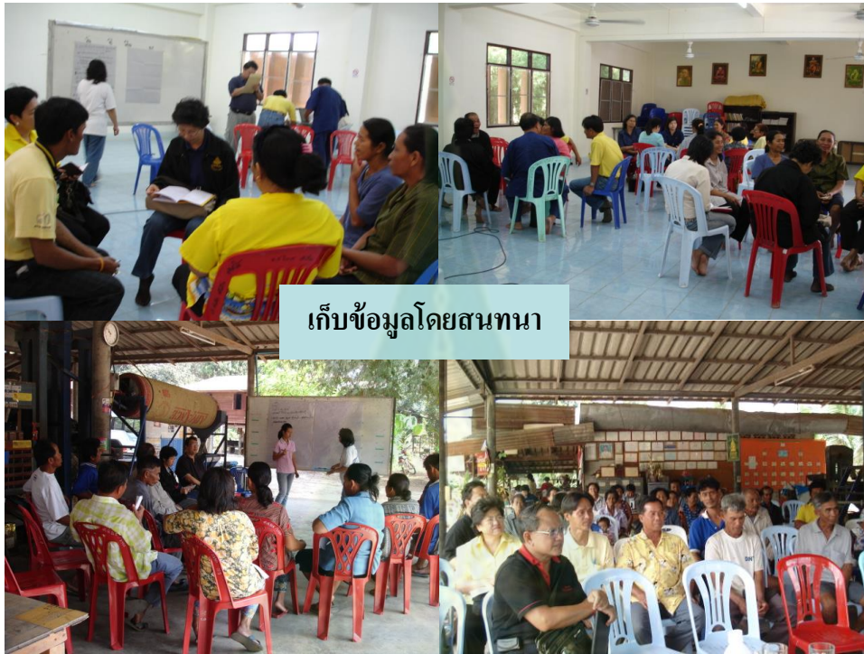
ภาพที่ 5.1 การเก็บข้อมูลด้วยการสนทนากลุ่มย่อยที่บ้านวังยาว ตำบลเที่ยงแท้

กิจกรรมที่กลุ่มดำเนินการ ได้แก่ ผลิตเมล็ดพันธุ์แล้วขาย โรงเรียนเกษตรกร ขายเมล็ดพันธุ์ โดยคนที่เป็สมาชิกกลุ่มจะขายเป็นเงินเชื่อให้กับสมาชิก กิจกรรมการปันผลประโยชน์ให้สมาชิก มีการปันใน 3 รูปแบบ คือปันผลตามหุ้น สมาชิกได้รับประโยชน์โดยซื้อเมล็ดพันธุ์เชื่อและซื้อในราคาถูก และมีสวัสดิการครอบครัว ถ้าคนในครอบครัวสมาชิกเสียชีวิตจะได้รับเงินสวัสดิการคนละ 500 บาท/คน นอกจากนี้สมาชิกสามารถซื้อหุ้น 100 บาท/หุ้น ไม่เกินคนละ 5 หุ้น