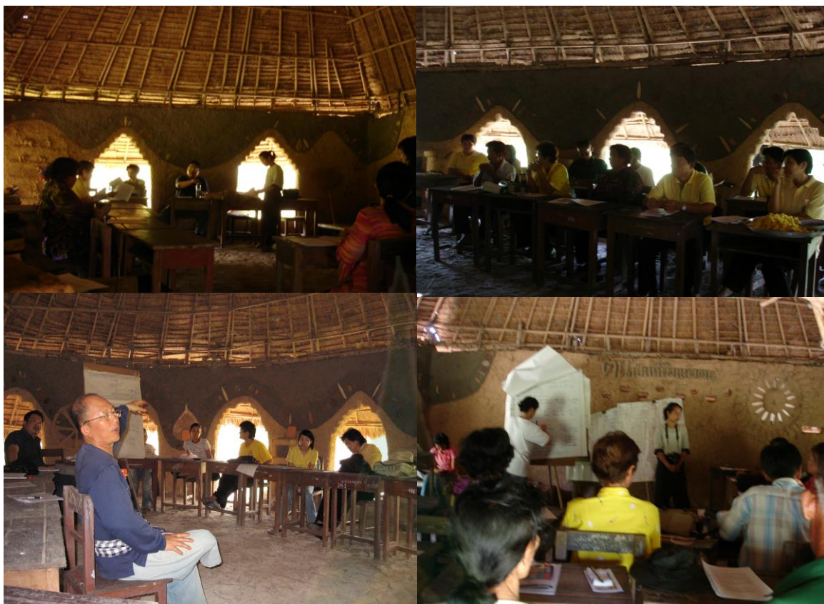
ภาพที่ 5.4 เวทีแลกเปลี่ยนเรียนรู้ร่วมกันระหว่างนักวิจัยกับผู้นำและชาวบ้านตำบลท่างาม

ปัจจุบันกลุ่มอาชีพเกษตรกรพัฒนาแห่งแม่น้ำปราจีนบุรี ประกอบด้วยกลุ่มย่อยๆ ดังนี้