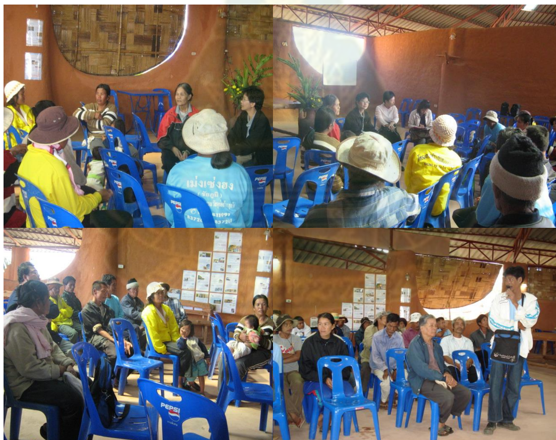
ภาพที่ 5.5 เวทีแลกเปลี่ยนเรียนรู้ร่วมกันระหว่างนักวิจัยกับผู้นำและชาวบ้านเทพนา

กลุ่มในบ้านเทพนา ตำบลบ้านไร่ อำเภอเทพสถิต จังหวัดชัยภูมิ มีกลุ่มที่เป็นทางการอยู่ 2 กลุ่ม คือ กลุ่มเกษตรกรทำสวนและกลุ่มวิสาหกิจชุมชน ต. บ้านไร่ ทั้ง 2 กลุ่มมีการประชุม ทุกวันที่ 20 ของเดือน มีการประชุมคณะกรรมการสัปดาห์ละครั้ง ( 17 น. ของวันอาทิตย์) การทำงานของกลุ่มขึ้นอยู่กับกรรมการและสมาชิกของบ้านดิน ซึ่งภายใต้กลุ่มทั้ง 2 กลุ่มนี้ มีการดำเนินการเป็นกลุ่มย่อยๆ 4 กลุ่ม โดยทั้ง 4 กลุ่มเป็นกลุ่มที่ได้รับมอบหมายให้ทำงานในแต่ละส่วนเพื่อรองรับการท่องเที่ยวบ้านดิน